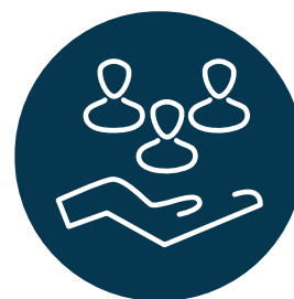
Bouwen aan een familie

Deze waarden kenmerken ons als bedrijf en verduidelijken 'wie we zijn en 'waar we voor staan'. Ze maken integraal deel uit van onze dagelijkse activiteiten en bepalen hoe wij er als professionele speler uitzien. Samen vormen ze het DNA van onze organisatie en de bouwstenen voor onze Ethiek & Gedragscode.